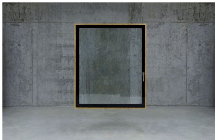
Keyvisual Fenster. Pfad: imagens/fenster_01.jpg

Weco revolutioniert das traditionelle Holzfenster. Wir implementieren die neuesten technischen Errungenschaften, um ein neues, leistungsstarkes Design zu schaffen, das sowohl Elegant als auch Innovativ ist.