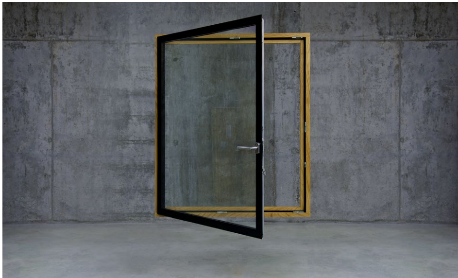
Keyvisual Fenster. Pfad: imagens/fenster_02.jpg

Das innovative Konzept von Weco führt zu einem Design, das sich durch Einfachheit, Detailqualität und Eleganz auszeichnet und die Wärme des Holzes mit der zeitgemäßen Attraktivität des ununterbrochenen Glases verbindet.