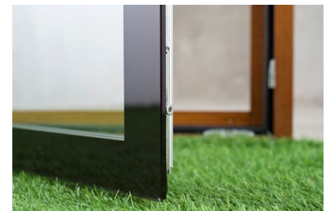
Keyvisual Fenster. Pfad: imagens/details_02.jpg