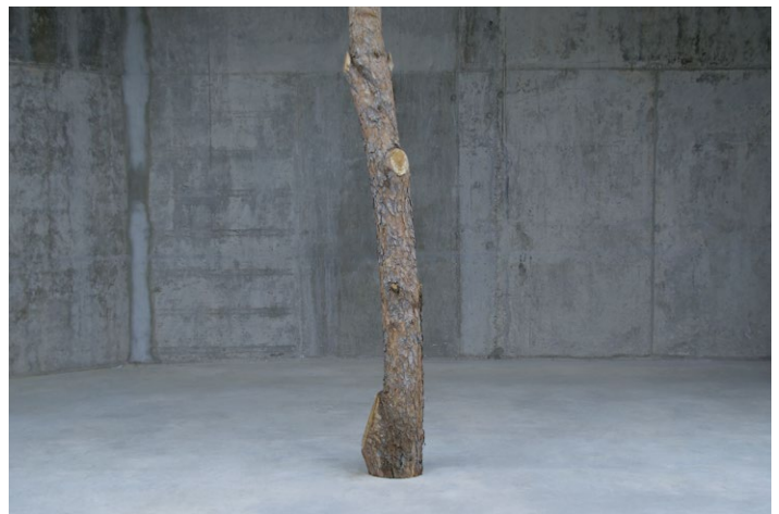
Keyvisual WecoWindows. Pfad: imagens/baum_01.jpg