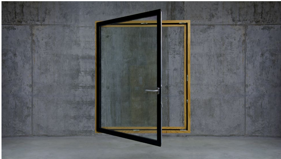
Keyvisual Fenster. Pfad: imagens/fenster_02.jpg

Das neuartige Konzept von Weco - ein Fassadensystem, das sich durch Einfachheit, Detailqualität und Eleganz auszeichnet. Der warme Baustoff Holz wird mit der zeitgemäßen Attraktivität eines durchgehenden Glasflügels kombiniert.