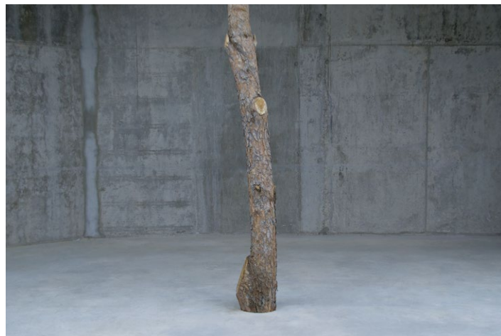
Keyvisual WecoWindows. Pfad: imagens/baum_01.jpg

Weco revolutioniert das traditionelle Holzfenster. Wir implementieren die neuesten technischen Errungenschaften, um ein neues, leistungsstarkes Design zu schaffen, das sowohl Elegant als auch Innovativ ist.