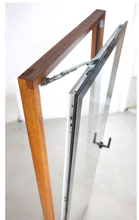
Keyvisual Fenster. Pfad: imagens/details_03.jpg