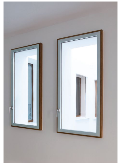
Keyvisual Projekte. Pfad: imagens/projekte_02.jpg