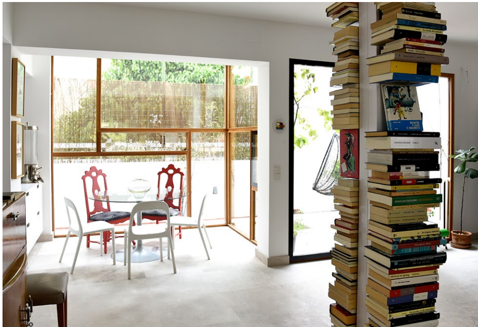
Keyvisual Projekte. Pfad: imagens/projekte_01.jpg