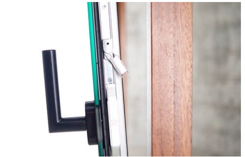
Keyvisual Fenster. Pfad: imagens/details_01.jpg

Das Fenster wird kundenspezifisch von unseren Spezialisten angefertigt und vor Ort installiert. Die Low-E Doppelverglasung aus VSG und beschichtetem Floatglas kann zur verbesserten Energieeffizienz mit einer Argon-gefüllten Kammer versehen werden. Am Glas wird ein umlaufendes produktspezifisch entwickeltes Aluminiumprofil befestigt, welches die Beschläge, einschließlich des Verriegelungszuges mit Einbruchschutz aufnimmt. Drei separate umlaufende Dichtungsbänder, die auch produktspezifisch vom Hersteller entwickelt wurden, gewährleisten maximale Energieeffizienz, Dichtigkeit und Komfort. Der Wandrahmen ist aus schichtverleimtem Vollholz gefertigt und mit einer vierfach Lackierung aus ökologischen Ölen geschützt, die bis zu 15 Jahre Garantie aufweisen. Das Fenster wird aus spanischem Kastanienholz (aus zertifiziert nachhaltigem Anbau) hergestellt, kann auf Wunsch auch aus anderen Edelhölzern hergestellt werden. Der Außenrand der Innenverglasung ist in schwarz, weiß, Metalloptik oder einer Vielzahl von Einbrennlackierungen der RAL-Palette verfügbar.